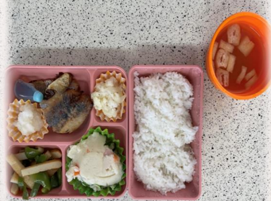
キッチンだいたい