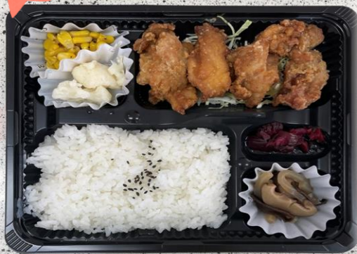
ノースバーランド

2024年が始まり早半年が経過しましたが、皆様はいかがお過ごしでしょうか。6月は気温が30℃近くまで上昇する日が度々ありましたが、体調を崩すことはありませんでしたか？気象庁の予想では今年の夏は全国的に気温が高くなるそうです。少しでも不調を感じたらスタッフへご相談下さい。