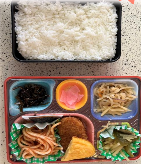
ひので給食センター