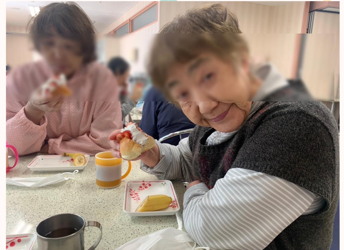
フルーツサンド会食